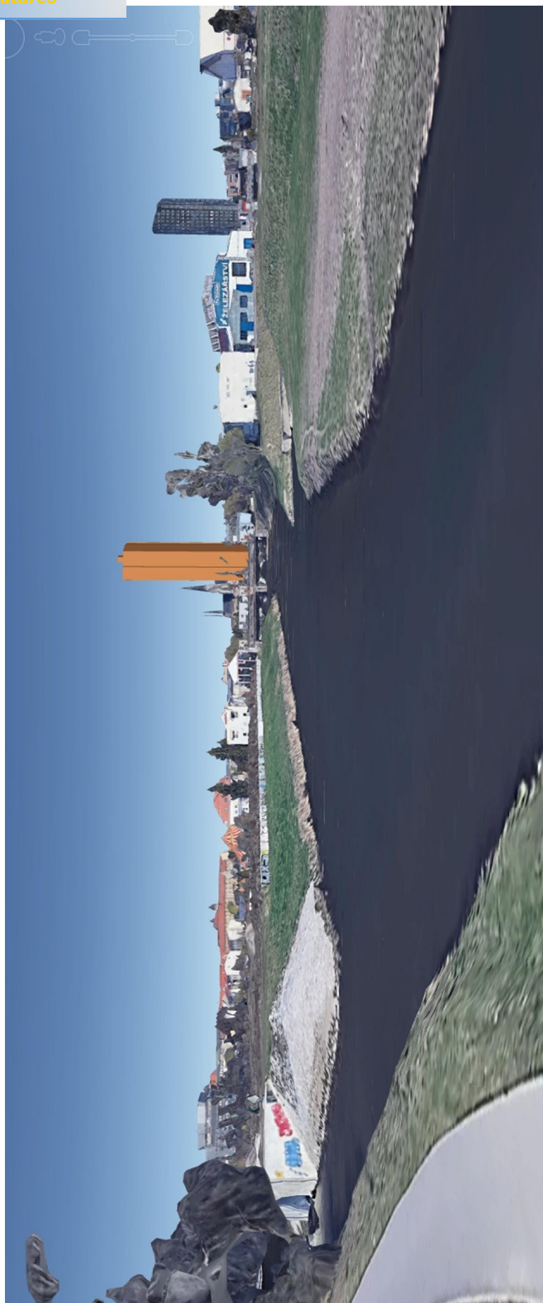
Obr. 07. Pohled z cyklostezky u mostu na Velkomoravské (Švýcarské nábřeží) k Šantovka Tower. Pozice GPS 49°34'56.02"N, 17°15'42.06"E