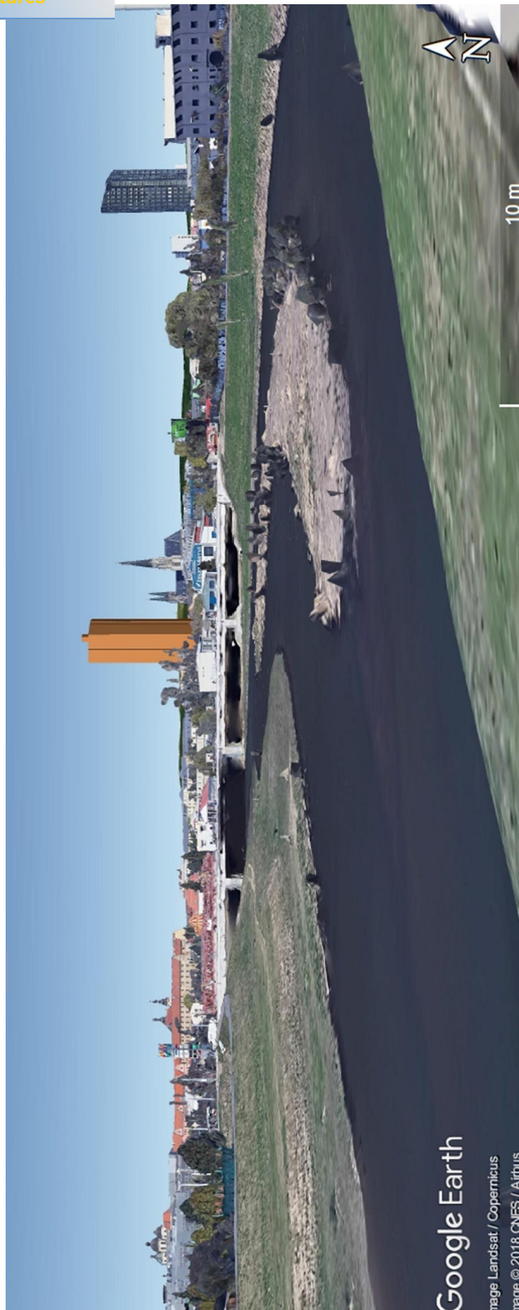
Obr. 05 Pohled z ulice U Rybářských stavů k Šantovka Tower. Pozice GPS 49°34'40.6654"N, 17°15'47.6510"E